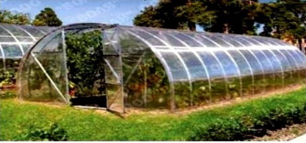
الوثيقة (1) بيت بلاستيكي

الوضعية الأولى (06 نقاط) : في إطار الدعم الفلاحي ، تحصل عمي صالح على 5 بيوت بلاستيكية لتطوير الانتاج الفلاحي في المناطق الريفية . حيث تعتبر البيوت البلاستيكية فتحا جديدا في عالم الزراعة لأنها توفر للنبات الظروف المناسبة لنموه . كما توضح الوثيقة (1)